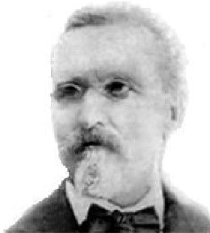
Eduard Huet (1822-1882) Professor Surdo francês - Criador da Libras